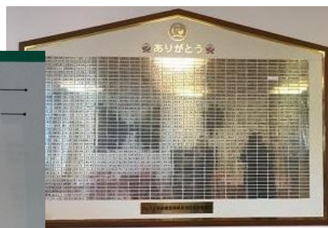
↑淡路ふくろうの郷 募金感謝プレート

オルグ申し込み、ニュース投稿など、聴覚障害者福祉施設建設推進委員会事務局まで TEL: 371-3071 FAX: 371-3052 (神戸ろうあ協会内) mail: hitoribotch_0@yahoo.co.jp